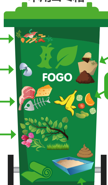
食糧および草木用ゴミ箱